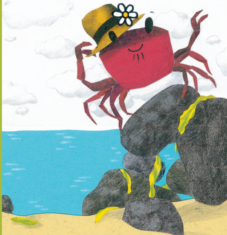
Ilustración: Rocío Martínez