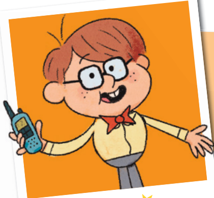
★ Doc ★

Doc Watson es el mejor amigo de Sherlock. Está siempre en contacto con él gracias a sus superwalkie-talkies .