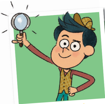
★ Sherlock ★

Sherlock tiene siete años y vive rodeado de enigmas. Su padre, el gran Sherlock Holmes, le ha enseñado a descifrarlos desde su más tierna infancia. Como buen detective, nunca sale de casa sin su lupa.